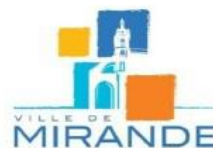
Photo Club MIRANDAIS